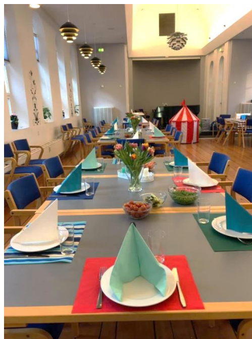
Fællesspisning på Sct. Maria Park