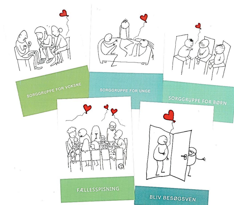
Et udpluk af Menighedsplejens informations-postkort – lige til at dele ud!